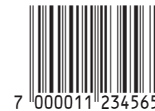
Minste mulige størrelse 80% (29,83 mm inkl. lysmarg).

Både EAN 13- og EAN 8-symbolet kan trykkes i forskjellige størrelser, nemlig fra 80 til 200% av den såkalte nominelle størrelsen. Alle strekkoder må ha såkalt lysmarg rundt.