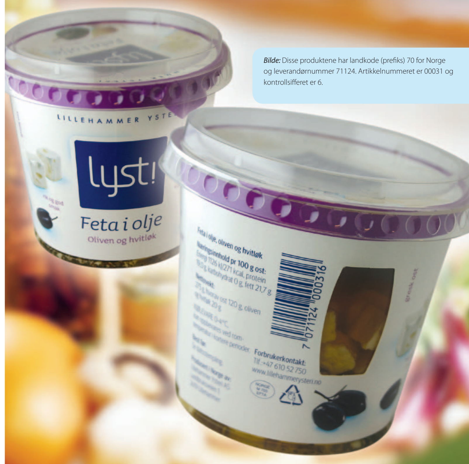
Bilde: Disse produktene har landkode (prefiks) 70 for Norge og leverandørnummer 71124. Artikkelnummeret er 00031 og kontrollsifferet er 6.