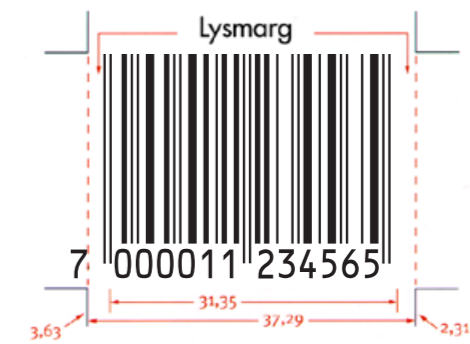
Alle strekkoder må ha en såkalt lysmarg rundt.