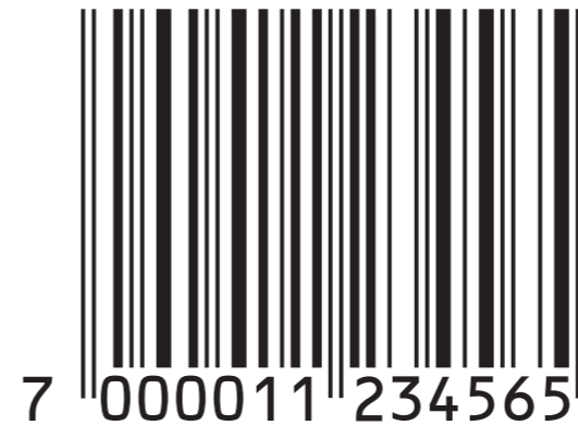
Største mulige størrelse 200% (74,58 mm inkl. lysmarg).